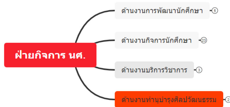
รูปที่ 1 โครงสร้างการบริหารงานของฝ่ายกิจการนักศึกษาและบริการวิชาการ

การบริหารงานฝ่ายกิจการนักศึกษาและบริการวิชาการ สามารถแสดงในแผนภาพที่ 1